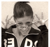
Claudia Bosco Modern Jazz